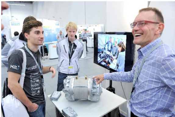
Bildunterschrift: Interessierte Fachbesucher im Gespräch auf der Messe.